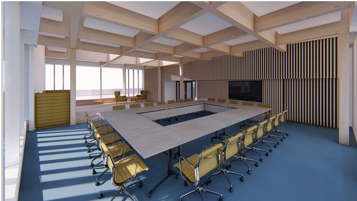
Vizualizácia: Zasadacia miestnosť.

Vonkajšia biela uličná fasáda ostane nezmenená a dvorová fasáda bude vysunutá do átria, čím sa privedie do temného jadra prirodzené denné svetlo. Tento zásah nielen zväčší plochu kancelárií, ale umožní aj vznik nového spoločenského priestoru v strede budovy. Vysoké nároky na požiarne bezpečnosť neumožnili použitie drevených lamiel na tienenie, takže sa použili hliníkové.