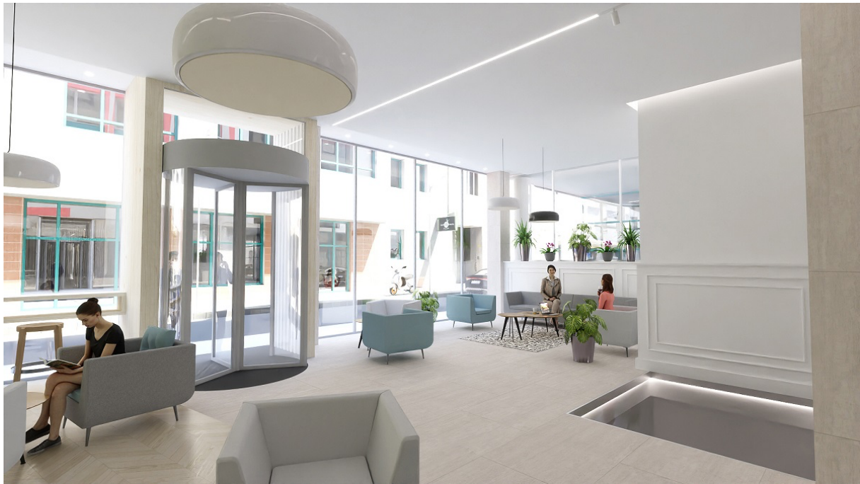
Vizualizácia: Vstup do budovy advokátskej komory | Zdroj: Ateliér VAN JARINA

Slovenská advokátska komora bude projekt s predpokladanými nákladmi 3,5 až 4,5 mil. eur bez DPH plus mobiliár financovať z vlastných zdrojov a z bankového úveru. Súčasne chce komora advokátom predstaviť iné spôsoby, akým sa môžu podieľať na financovaní rekonštrukcie.